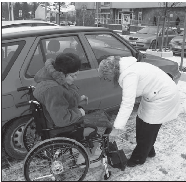
OSOBNÍ ASISTENT pomůže nejen doma, ale doprovodí klienta k lékaři nebo je společníkem na procházkách.

Prostřednictvím naší služby podporujeme rozvoj nebo alespoň zachování stávajících schopností uživatele a jeho setrvání ve vlastním domácím prostředí. Motivováním klientů k maximální soběstačnosti se snažíme vytvářet podmínky pro aktivní stárnutí seniorů, které je i hlavním tématem Evropského roku aktivního stárnutí a mezigenerační solidarity 2012. Osobní služba je převážně zajišťována v domácím prostředí klienta, ale jedná se také o doprovod klientů k lékaři, do zaměstnání, do školy, za kulturou nebo jen tak na procházky. „Projekt osobní asistence můžeme profesionálně provádět a rozšiřovat i díky podpoře a spolufinancování statutárního města Ostrava a městského obvodu Ostrava-Mariánské Hory a Hulváky,“ řekla pracovnice organizace Podané ruce Ivana Mikulcová. Potřebujete-li službu osobní asistence pro své blízké, kontaktujte pracovníky organizace na tel. čísle 777 011 934, paní Kovalská nebo e-mailem osa.ostrava@podaneruce.eu. Více informací o organizaci Podané ruce, o. s. – Projekt OsA naleznete na webových stránkách www.podaneruce.eu.