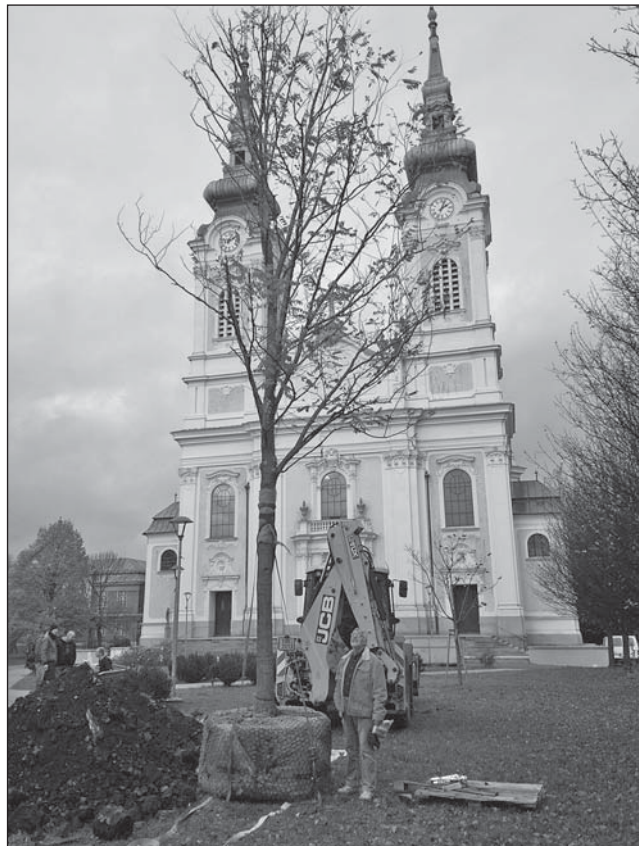
AKÁTY. Stojanovo náměstí před kostelem se na jaře opět více zazelená. Vysadili jsme tady dva vzrostlé stromy akátů za věkem ztrouchnivělé katalpy. Jeden červený a druhý bílý.

Oldřich Chytil děkan, FSS OU Dana Sýkorová , garantka vědecko-výzkumného projektu, FSS OU